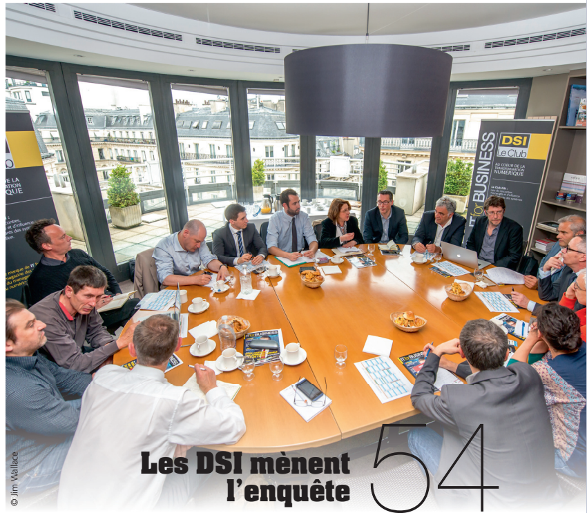
Les DSI mènent l'enquête