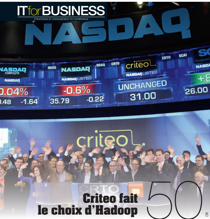
Criteo fait le choix d'Hadoop